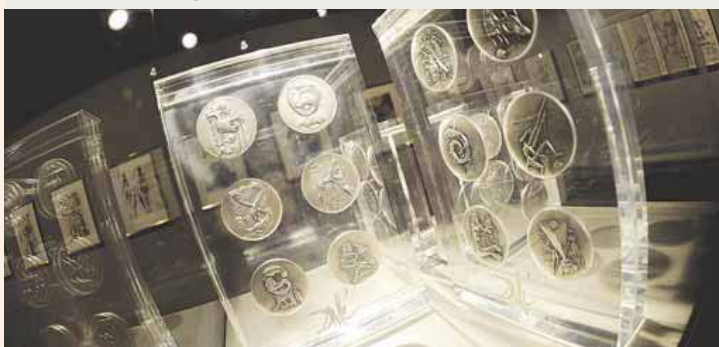
Серебряные монеты, дизайн которых принадлежит испанскому художнику Сальвадору Дали, выставил музей Дали в Берлине. На открывшейся сегодня экспозиции представлено более 400 работ известных сюрреалистов.

9 миллиардов рублей - такую сумму потребуют кредиторы с авиакомпании 57. Капитализация всей 57 сейчас составляет около 10 миллиардов рублей.