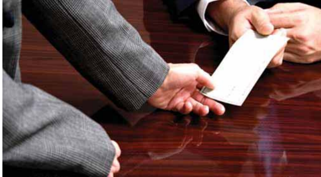
Ситуация на рынке труда и готовность людей работать на любых условиях провоцируют уход предприятий на "серые" и "черные" схемы оплаты.

В ПОЛУКУ РАБОТОДАТЕЛЕЙ, практикующих серые схемы выплат, прибыло. По данным опроса, который провел в марте портал HeadHunter, 12,4% компаний из числа тех, которые не выдавали зарплаты в конверте до кризиса, в той или иной степени перешли сейчас на этот способ расчета. Из числа компаний, которые не использовали "серые" схемы до кризиса и не перешли на них с его наступлением, как минимум 2,2% все же планируют этот шаг в обозримом будущем.